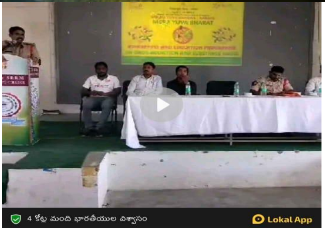
4 కేళ్లు మంది భారతీయుల విశ్వాసం